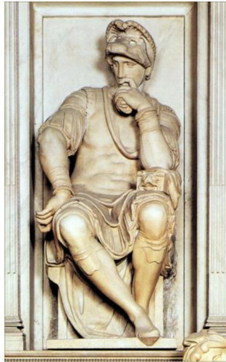
Tombeau de Laurent de Médicis , sculpté par Michel-Ange de 1519-1534, Florence.