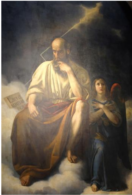
St Matthieu , Constantin Prévost (1832)